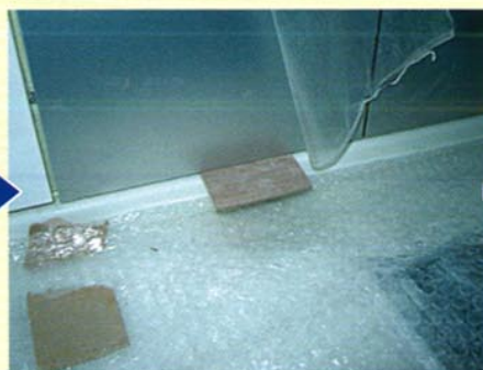
⑤シーリング用目地材挿入