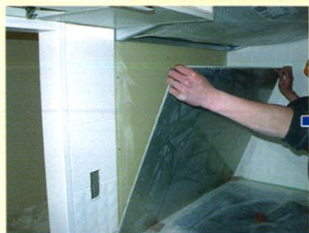
④キッチンパネル貼り合わせ