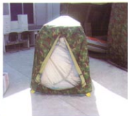
MS-ZY3型屏蔽帐篷（充气式）