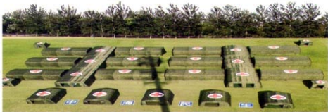
军用野战充气帐篷群