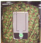
军用便携式移动充气厕所 HBL-1型便携式淋浴装置（充气式）