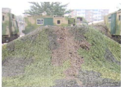
80平米指挥作战充气帐篷（正在充气）