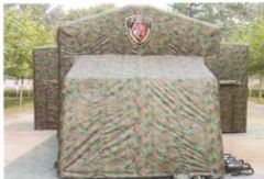
MS-JY40型军用多功能高级指挥充气帐篷（正面）MS-JY40型军用多功能高级指挥充气帐篷（侧面）