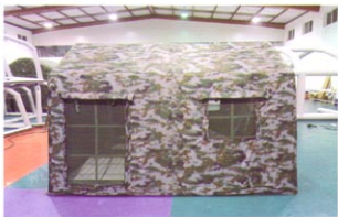
MS-JY7型首长专用充气帐篷（新型数码迷彩）