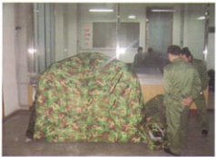
MS-JY3型充气帐篷（士官用）