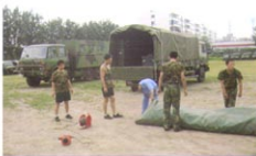
80平米指挥作战充气帐篷（准备充气）