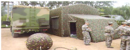
MS-JY40型多功能高级指挥充气帐篷演习（充气成型）