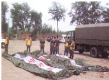
MS-ZJ40型军用医疗洗消帐篷（准备充气）