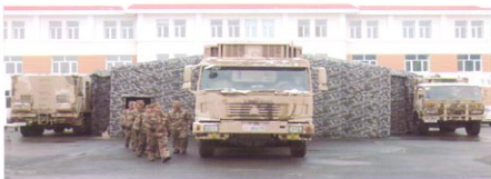
军用作战指挥充气帐篷