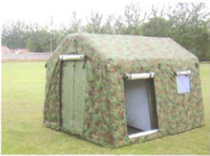
MS-JY7型多功能高级充气帐篷（首长用）