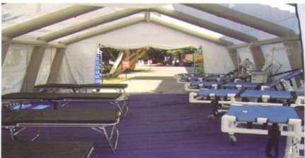
MS-2J50型军用医疗充气帐篷