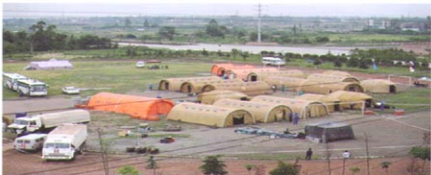
医疗救灾充气帐篷移动医院系统（汶川救援实景）