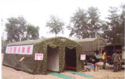
MS-ZJ40型军用医疗洗消充气帐篷