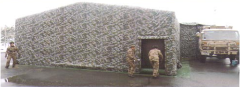
军用作战指挥充气帐篷（侧面）