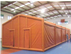
MS-ZJ132型多功能充气帐篷 (侧面)