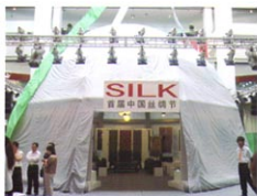
180平米展览帐篷实景