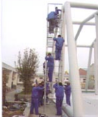
大型充气帐篷骨架施工中