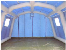
MS-ZJ20型结构式充气帐篷（内部结构）