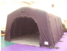
MS-ZJ28型结构式充气帐篷（单卷门）