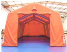
MS-ZJ20型结构充气帐篷 (美式)