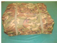
结构式充气帐篷包装