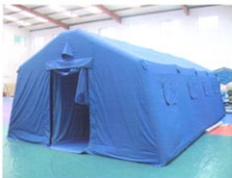
MS-ZJ40型多功能充气帐篷 (侧面)