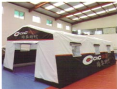
MS-ZJ40型户外车展充气帐篷