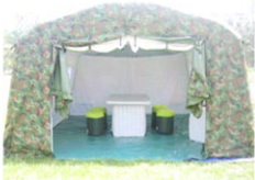
MS-ZJ30型结构充气帐篷 (正面)