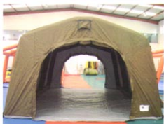
MS-ZJ28型结构式充气帐篷（双卷门）