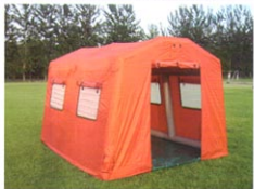
MS-ZJ10型结构式充气帐篷