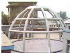
180平米展览帐篷气柱支架