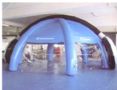
MS-ZJ40型户外车展充气帐篷