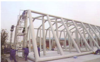
MS-ZJ300型大型充气帐篷骨架