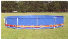
多边形框架组装式泳池