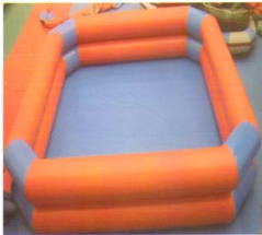
充气式泳池（长方形）