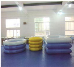
婴幼儿充气游泳池