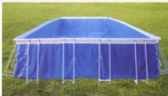
框架组装式泳池（长方形）