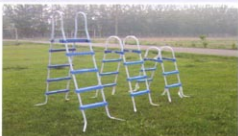
框架组装式泳池扶梯