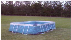
框架组装式泳池（长方形）