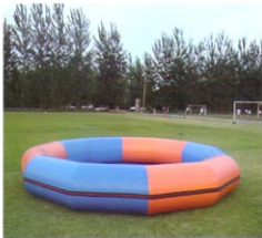
充气式泳池（十二边形）