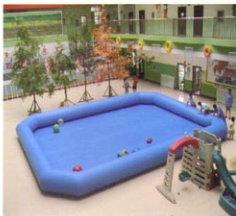
充气式泳池（长方形）